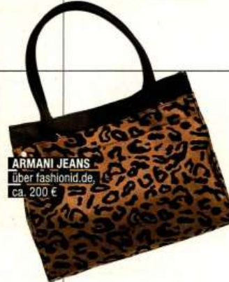
ARMANI JEANS über fashionid.de ca. 200 €