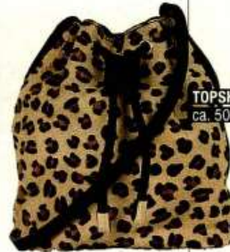
TOPSHOP ca. 50 €