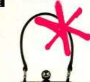
DOLCE & GABBANA über net-a-porter.com ca. 1650 €