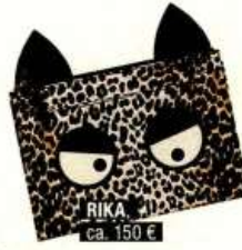
RIKA ca. 150 €