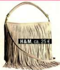
H&M ca. 25 €