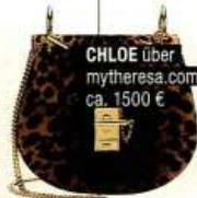
CHLOE über mytheresa.com ca. 1500 €

Bestimmt werden auch Sie anfangen zu jubeln, wenn Sie eine der neuen Roarr-Taschen besitzen. So gefährlich sexy, diese Wildkätzchen.