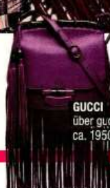
GUCCI über gucci.com ca. 1950 €