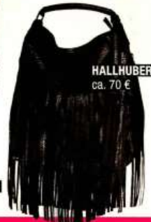
HALLHUBER ca. 70 €