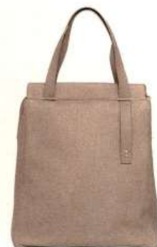
Front Row Society