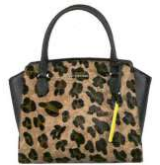
Cromia € 215